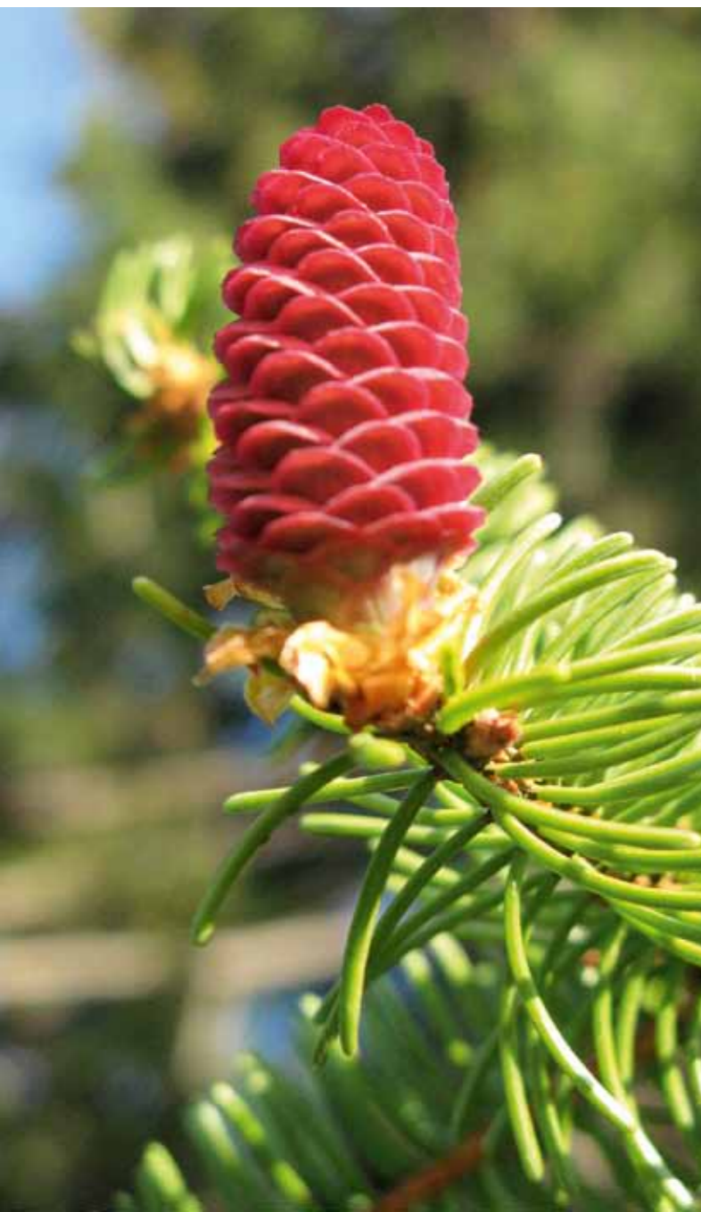
Fichtenblüte im Frühling, Schutzwald Rigi, Kt. Schwyz, Schweiz.

Weitere Informationen zu Einsatzmöglichkeiten, Projektorten, Arbeiten und Unterkünften über www.bergwaldprojekt.org