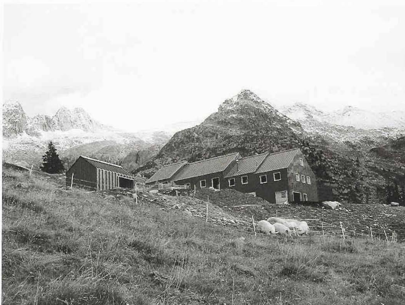
Das Algebäude ist dem Terrain folgend abgetrepppt. Vorne der Schweinestall im gleichen Material. (Bild: Gujan & Pally)