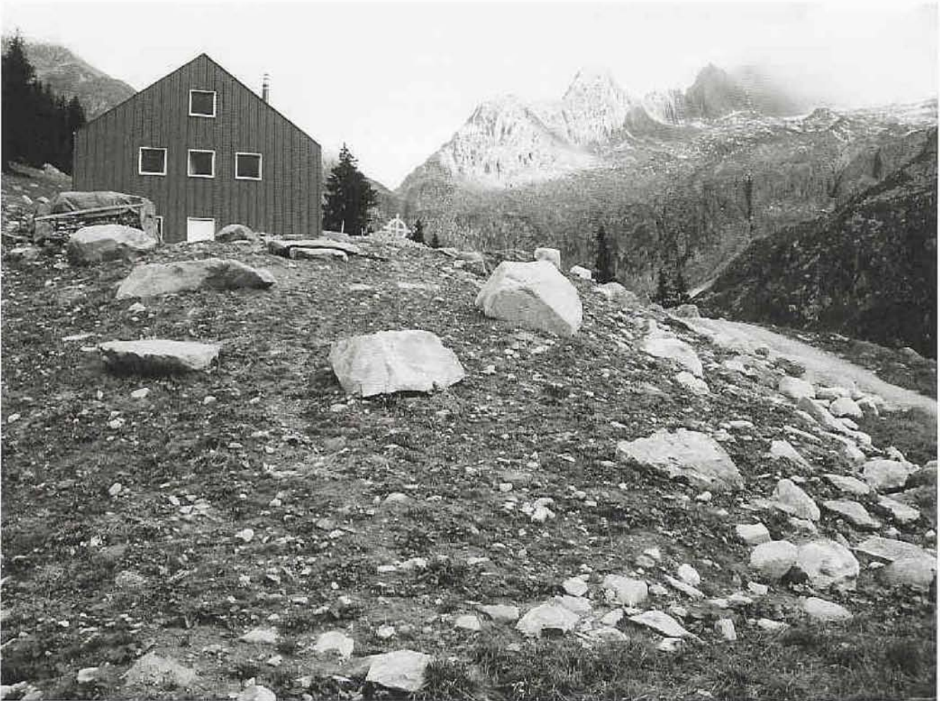
Der Neubau liegt oberhalb Fuorns auf 1850 Metern.