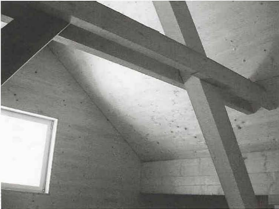
Im Obergeschoss der Sennhütte soll vielleicht für Wanderer ein «Schlafen auf der Alp» eingerichtet werden.

alle Ziegen gemolken und verschwinden wieder in die Berge. Ihre Milch fliesst einen Gebäudeteil weiter in die Käseerei, wo zwei «Kessi» stehen, damit unterschiedliche Produkte hergestellt werden können. Gekühlt wird mit Wasser, das von weither geholt werden musste, weil die bestehende Quelle zu wenig hergab. Dasselbe Quellwasser betreibt eine kleine Turbine, die die ganze Alp mit Strom versorgt. Auf einem Geschoss ist zuunterst im Gebäude eine einfache Sennhütte eingerichtet. Unter dem Dach können vielleicht mal Wanderfreudige, die beim Aufstieg in die Greina hier vorbeikommen, in einem Massenlager übernachten. «Schlafen auf der Alp» nennen das die Architekten. Im Keller wird der Käse gelagert. Die Schweine im Nebenhäuschen fressen die Abfallprodukte der Käseherstellung.