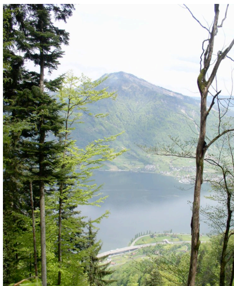
Abbildung 2: Rossberg

Am 2. September 1806 lösten sich am Rossberg, vis-à-vis der Rigi, auf der Fläche eines halben Quadratkilometers 40 Millionen Kubikmeter Gestein. Die Gesteinsmassen zerstörten die Dörfer Goldau und Röthen fast vollständig, Buosigen teilweise. Weil der Bergsturz im Lauerzersee eine Flutwelle (Tsunami) auslöste, waren auch die Dörfer Lauerz und Seewen betroffen. Der Fels begrub 6.5 Quadratkilometer meist fruchtbares Land, 457 Menschen und 323 Stück Vieh fielen dem schlimmen Ereignis zum Opfer, 5 Kirchen und Kapellen, 102 Häuser sowie 220 Ställe und Scheunen wurden zerstört. Die Hilfe für Goldau war die erste gesamtschweizerische Hilfsaktion für eine Katastrophenregion.