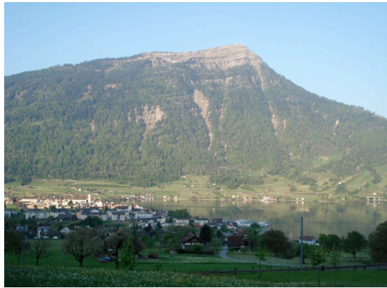
Abbildung 1: Die Rigi, im Vordergrund Arth am Zugersee

Das Bergwaldprojekt führt seit 1993 Einsätze an der Rigi Nordlehne durch. Die Rigi ist einer der beliebtesten Ausflugsberge der Schweiz mit traumhafter Aussicht. Am Fusse der Rigi, am Vierwaldstätter- und am Zugersee liegen die Bezirke Küssnacht und Schwyz.